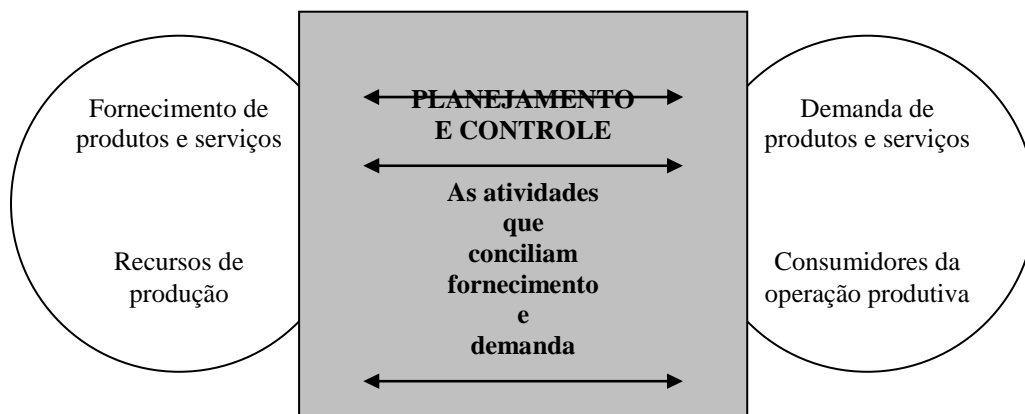
Figura 1 – A função de planejamento e controle concilia o fornecimento dos produtos e serviços de uma operação com sua demanda.

Preocupa-se, segundo Slack (1996), o planejamento e controle em gerenciar as atividades da operação produtiva de modo a satisfazer a demanda dos consumidores, mesmo que a formalidade e os detalhes dos planos e do controle variem. Na Figura 1 os diferentes aspectos do planejamento e controle podem ser vistos como representando a conciliação entre fornecimento e demanda.